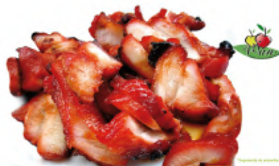
FILETE VEGETAL A LA BARBACOA